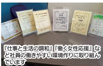
『仕事と生活の調和』『働く女性応援』など社員の働きやすい環境作りに取り組んでいます

数年前から従業員の健康については意識をしていました。 特に東日本大震災後、業務に追われ残業続きで体調を崩す社員が増え、業務にも影響がはじめていました。