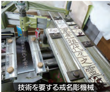
技術を要する戒名彫機械